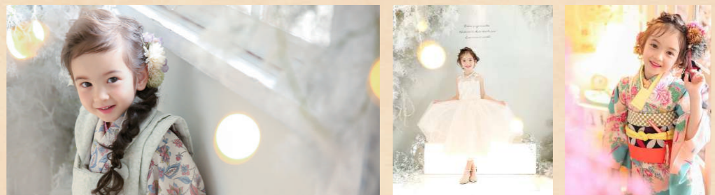
フレームやアルバムなどの商品はオプションとして追加でご注文いただけます。詳しくは→www.studio-ism.jp